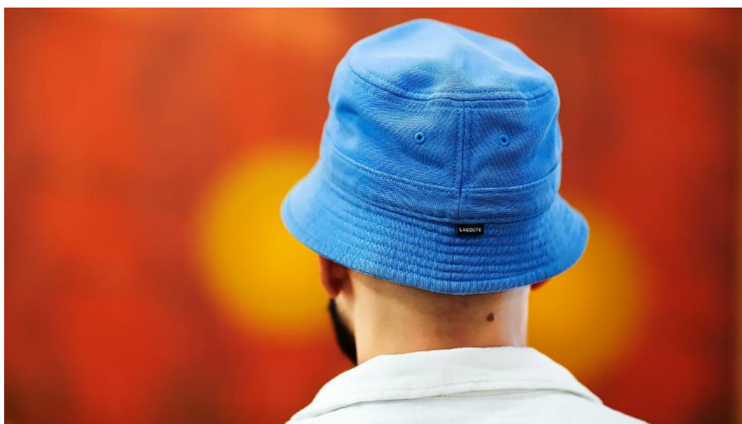
Foto: Carl von Scheele. Bild på Mokhtar från en kulturutflykt på Svenska institutet i maj 2025.

Vi vill också särskilt tacka den anonyma givare som räddade LAMSF:s ekonomi förra året och gjorde det möjligt för oss att fortsätta hjälpa.